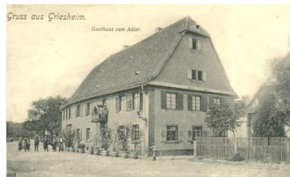
Gruss aus Griesheim.